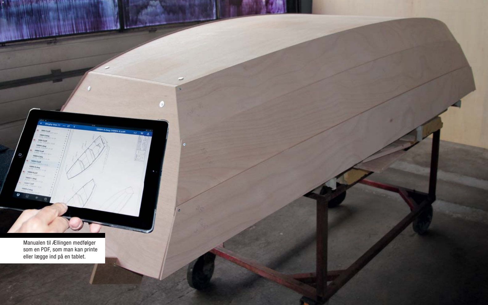
Manualen til Ællingen medfølger som en PDF, som man kan printe eller lægge ind på en tablet.